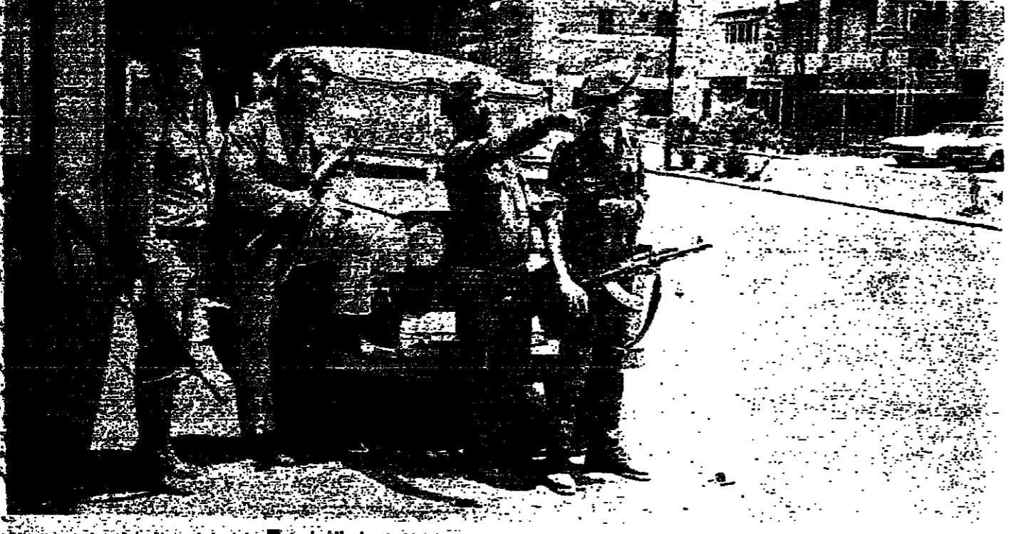
دورية مشتركة من رجال الدرك والتفاح المسلح في الضياع

( المطران الساعد في الاردن وسوريا ولبنان ) الذي توفاه الله اثر نوبة قلبه بفلحة ، وهو بعد في ربيع عمره في الضفة اللبنانية وفي الرتبة الاستاذية القديسة ، وسجوري مراسم الدفن في الكنيسة الانجيلية ( جبل عمان ) اليوم الأربعاء الموافق ٢٨ - ٥ - ٧٥ . ويكلمت الكتاب المقدس تقول : « نما انها السيد الصالح والدين كنت اجينا في القليل فتيقك علىي الكثير - ادخل الى فرح سيدك » .